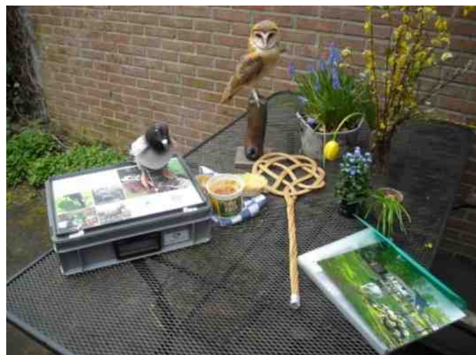
De inhoud van de koffer