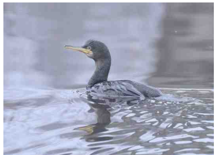
De veel bewonderde Kuifaalscholver