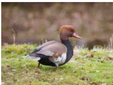
Mellany Goosselink maakte deze foto van de Krooneend