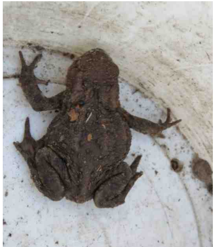
Deze moedige vrouw ging op pad ondanks de vorst!!