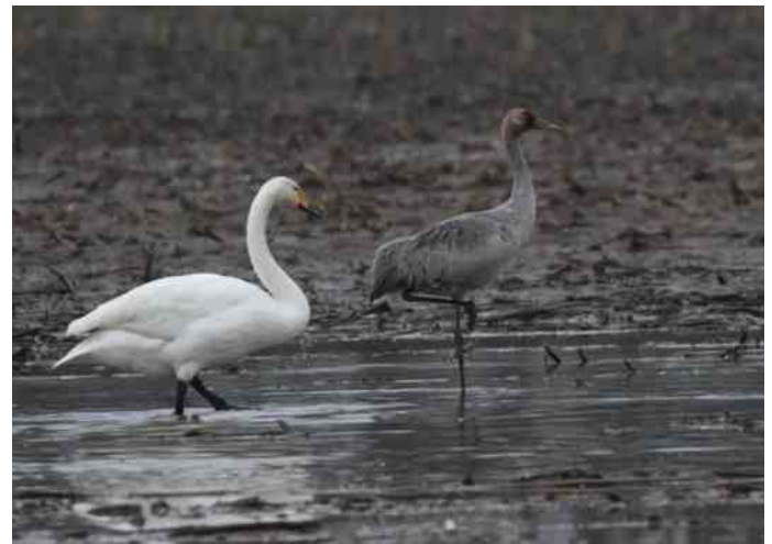
Parmantig stappen de Kraanvogel en de Wilde zwaan door het bouwland in de Noord Meene bij Gramsbergen