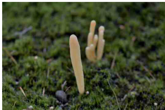
De Heideknotszwam in het Viperagebied