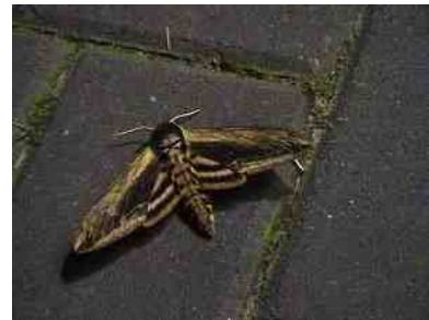
De Ligusterpijlstaart en de Vlekdaguil