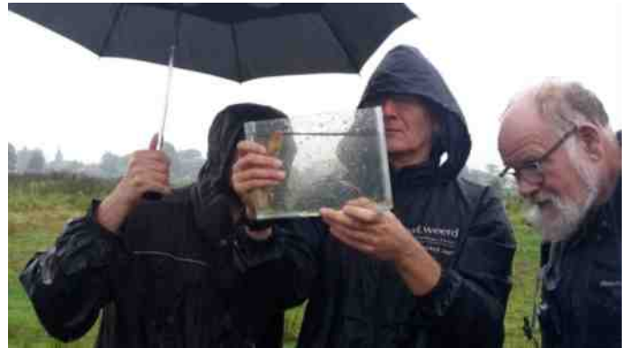
Zeer natte maar leuke visexcursie