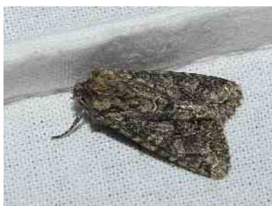
Het Eikenuiltje, foto Julian Overweg