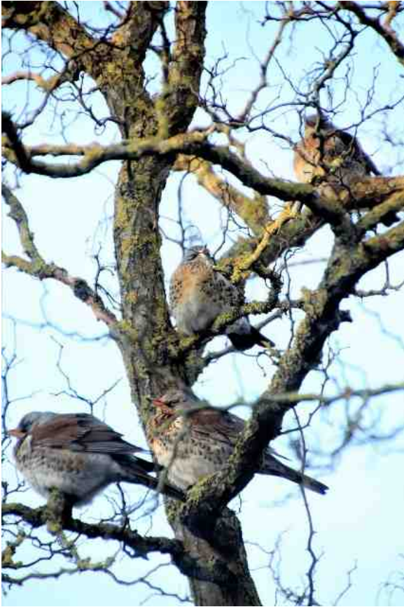
Rondom het huis van de familie Arendshorst vlogen de Kramsvogels in grote aantallen. Ze koesterden zich in het zonnetje!