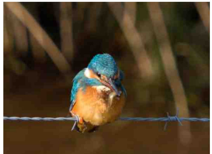
De Ijsvogel laat zich soms mooi fotograferen, met een visje in de snavel