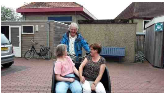
De 'Groene koets'