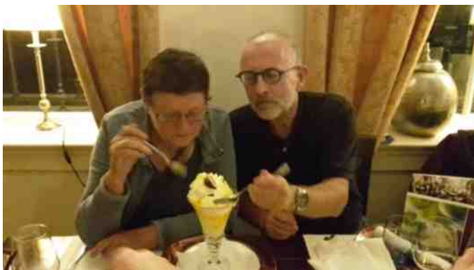
Ware liefde, een ijsje delen na een mooie dagexcursie langs Die Vechte