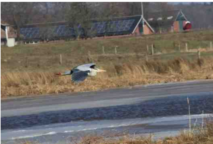
De Blauwe Reiger vloog boven het water op zoek naar een hapje. Ook deze vogels hadden het moeilijk in koude periodes. Verschillende keren werden uitgeputte exemplaren naar de vogelopvang gebracht.