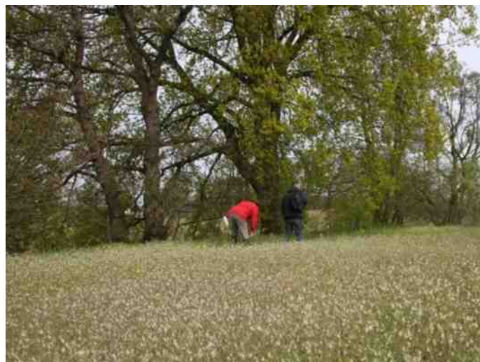
In het natuurgebied De Lange Kampen werden ook de plantjes geïnventariseerd.