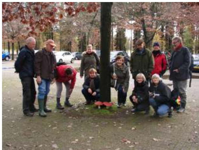
Paddenstoelenwerkgroep op de laatste paddenstoelendag van het seizoen 2019