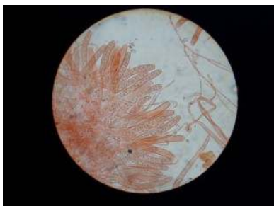
Arci, 400x vergroot