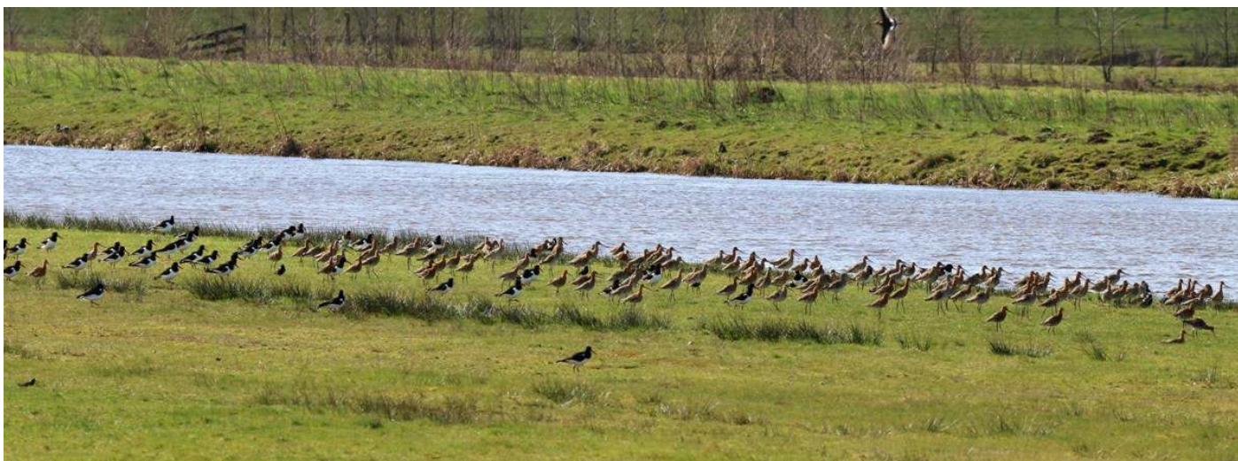
Héél veel vogels in het Vechtpark