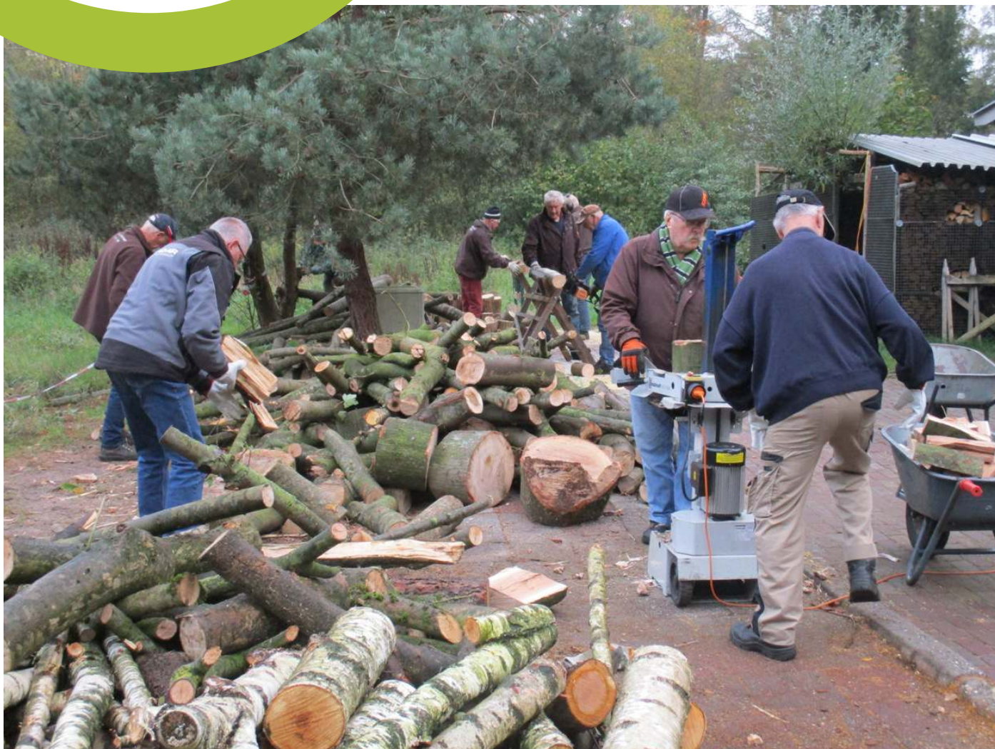
De houtgroep aan het werk

Verkrijbaar bij onze vereniging! Bel voor informatie en prijzen: 06-20009596.