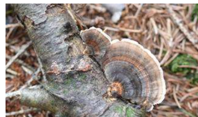
Gewoon elfenbankje

Het elfenbankje is al eeuwenlang een bekende geneesplant in de Chinese geneeskunde. Ook in de westerse, door modern wetenschappelijk onderzoek gestaafde fytotherapie wordt deze plant omhelsd als geneeskrachtige paddenstoel. In de Verenigde Staten zijn enkele veel belovende onderzoeken uitgevoerd die erop duiden dat elfenbankje of componenten ervan kankerwerende eigenschappen hebben.