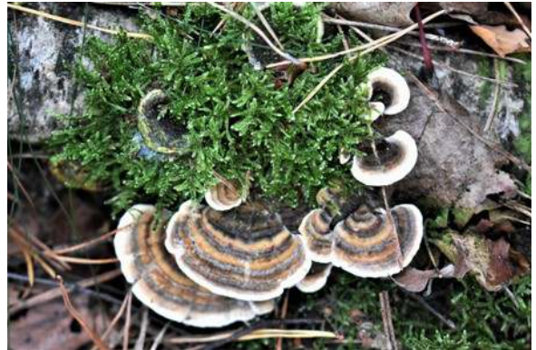
Elfenbankje

Elfenbankje is een paddenstoel die van nature voorkomt in Noord-Amerika en Europa. Ook in Nederland zie je deze paddenstoel volop, met name op rottend hout. Gewoon elfenbankje is een paddenstoel die wit, beige, okergeel, groen, oranje, bruin, blauw, grijs en zelfs zwart van kleur kan zijn. Het elfenbankje is technisch gezien eetbaar; dat wil zeggen dat het niet giftig is. Veel mensen vinden het geen lekkere paddenstoel. Mensen die hem wel in een maaltijd gebruiken koken vooral het jonge elfenbankje.