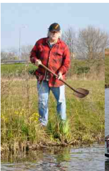
Beste stuurman aan de wal