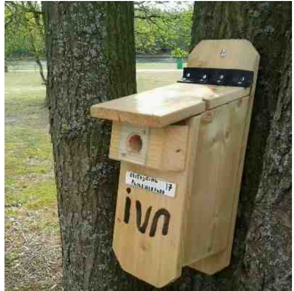
Een koolmees nestkastje ter bestrijding van de eikenprocessierups

Tekst en foto's: Geesje en Gerrit Lambers. Coördinatoren werkgroep nestkasten.