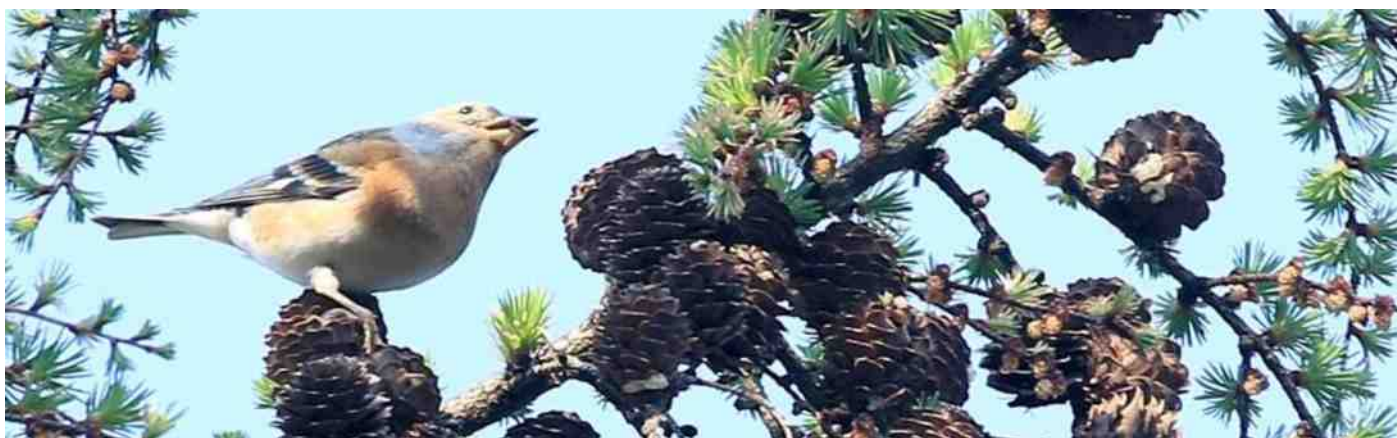
Keep.