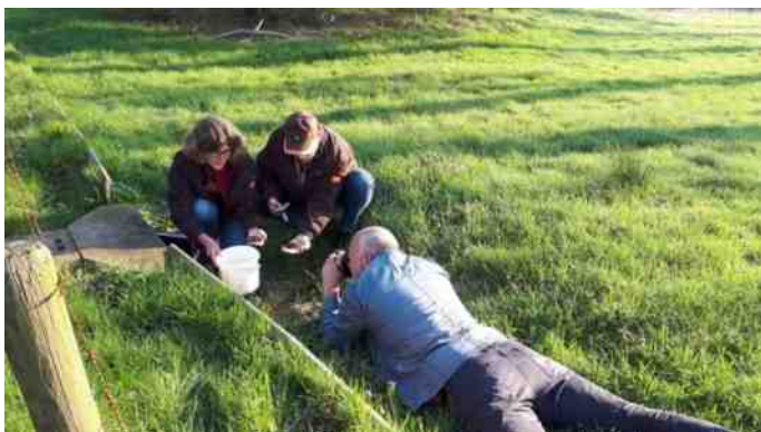
Ochtendronde langs de emmers.