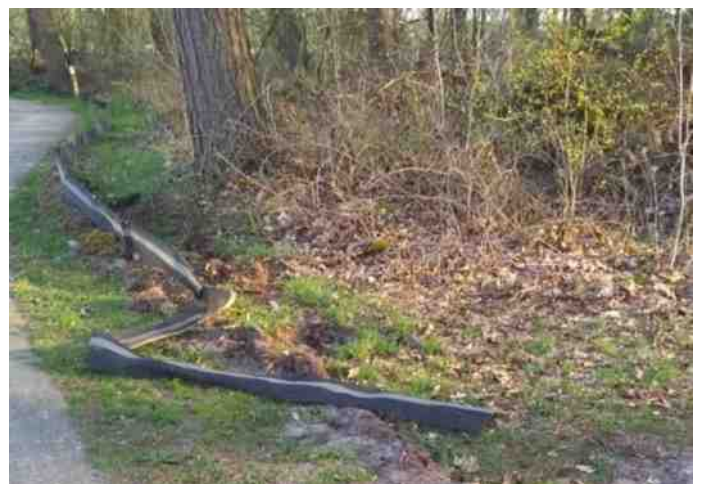
Het vernielde scherm bij het ruiterspad