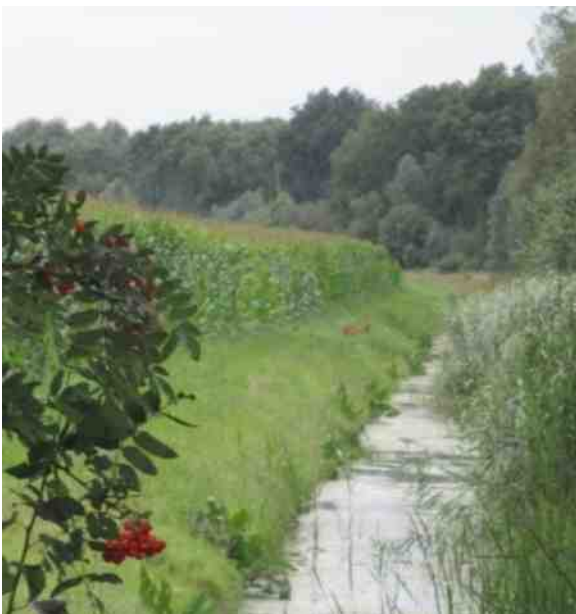
De Dooze bij Kloosterhaar