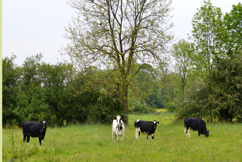
Kleine Foto's

Zondag 17 mei 10.00 uur Maasheggen in volle bloei De Pontipad Veerweg, Vortum